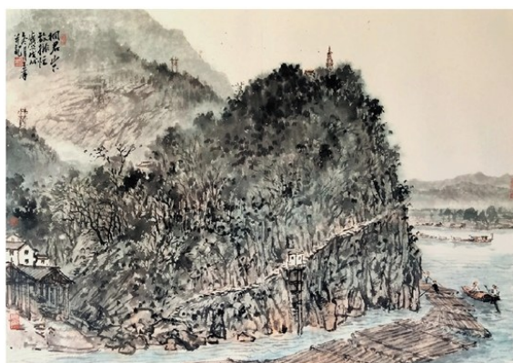
邵玉峰 浙江 国画桐君山记忆