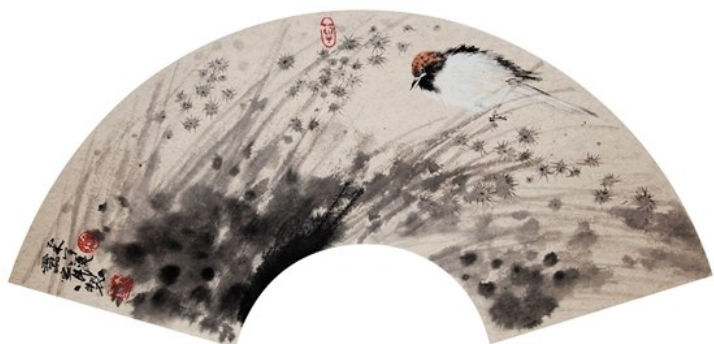
扇面 雷家民 熏风